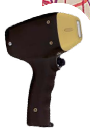
TRIO-Three In One (Alex 755nm, Diode 810nm, Nd:YAG 1064nm)