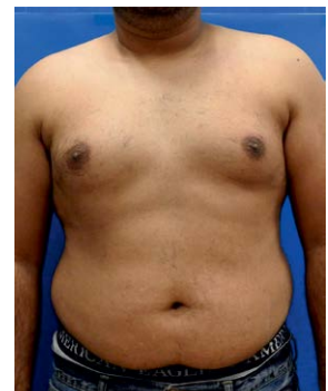
3D Κεφαλή Trio @ 10J/cm 2 Φωτότυπος IV-V Πριν και 1 μήνα | Μετά τη 2η θεραπεία